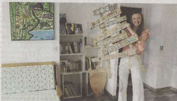
Un lieu qui porte des valeurs fortes.