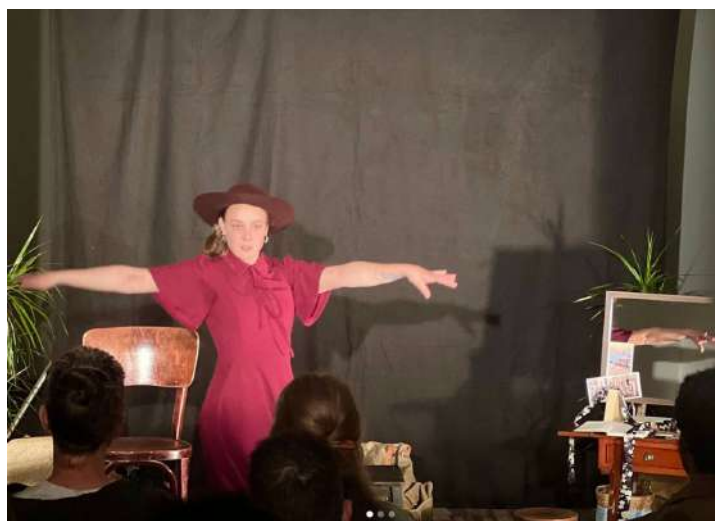
Pièce de théâtre ICI 25 septembre 2023