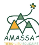
Pièce de théâtre Nelly Bly 23 mars 2023