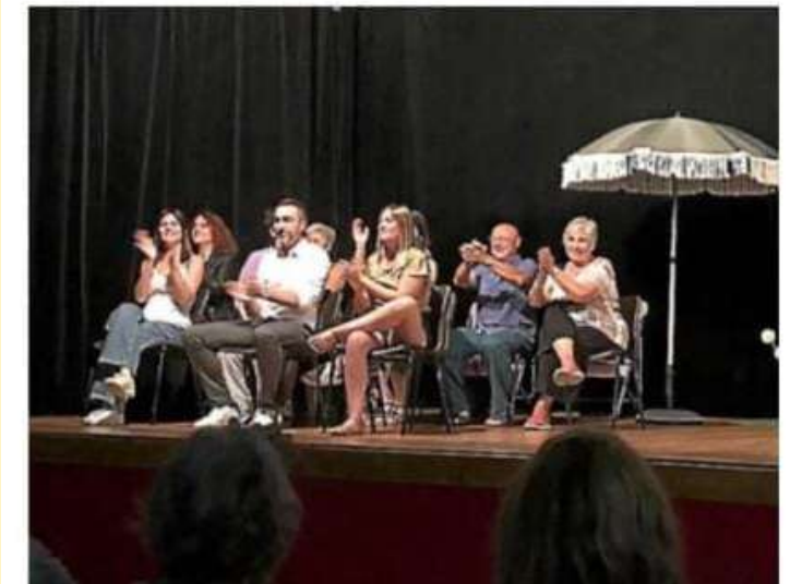
Les comédiens de BMS sur la scène de la salle Chabrol le 25 juin.

► Correspondant Midi Libre : 06 10 15 75 11