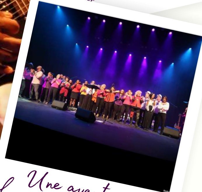
Une aventure humaine d'exception