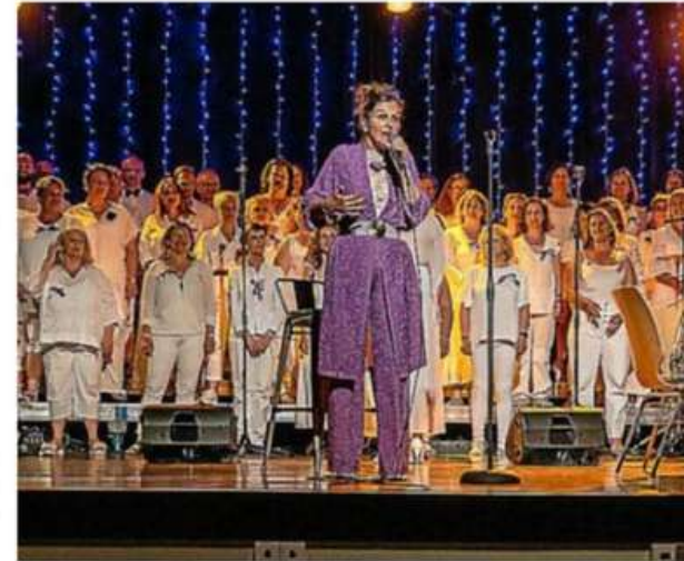
Ouverture des portes à 19 h 30.