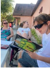
Lecture Hors les murs – enfants polyhandicapés

Aussi, on nous demande des animations hors les murs, ce qui engendre des frais de déplacements, mais c'est nécessaire dans notre territoire où les réseaux de transports sont très limités.