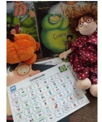
outils de lecture multisensoriel.

C'est un travail passionnant. Nous sommes très fiers des résultats déjà obtenus. Nous pensons qu'en mettant en place les adaptations nécessaires, chaque enfant peut aller à l'école, peut apprendre. Chaque personne peut occuper un travail, se découvrir une passion. Nous souhaitons donc que notre bibliothèque soit un terrain de découverte mais aussi une vitrine de la société inclusive. Nous souhaitons aussi que tous les aménagements matériels obtenus puissent servir au plus grand nombre. Finalement faire de la différence de chacun une richesse et valoriser les richesses humaines et matérielles de notre territoire.