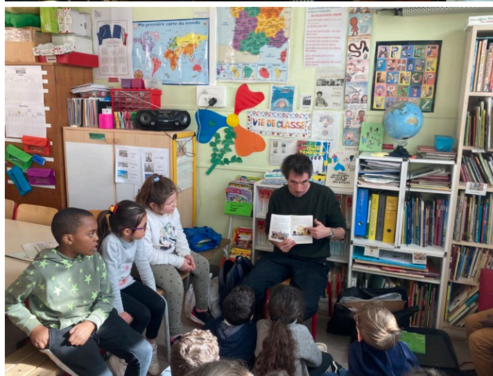
ateliers d'écriture en ephad, avec les anciens détenus au Théâtre du Châtelet, atelier de dessin à l'école.