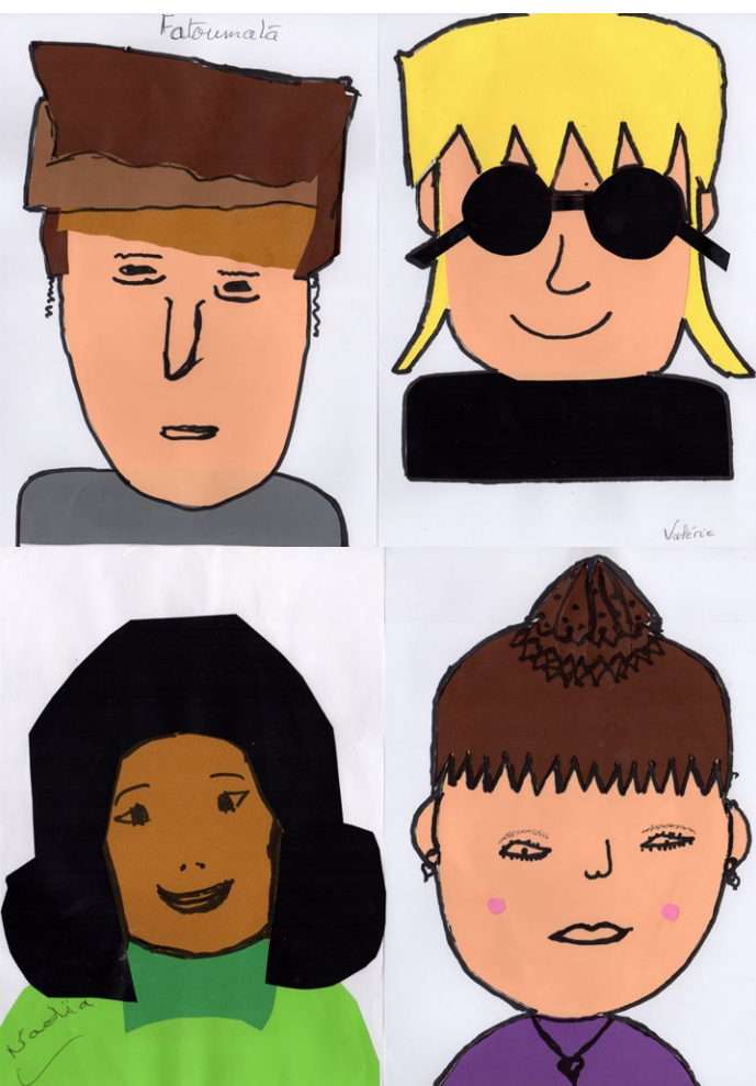
Portraits des résidents du Samusocial, d'élèves de CE1 et de personnes détenues