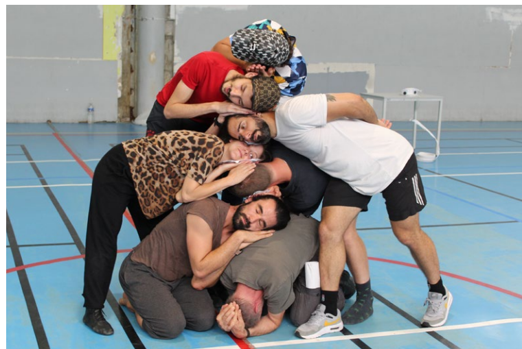
Recherche de figure collective - répétition centre pénitentiaire de Meoux

De cette rencontre se déroule ensuite toute l'adaptation du travail de texte à la musique, chaque participant travaillant avec les musiciens à définir ce qui est le plus adapté pour que les mondes s'assemblent.