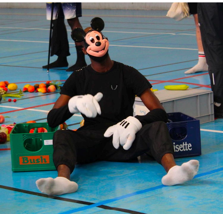
Répétition au centre pénitentiaire de Meaux