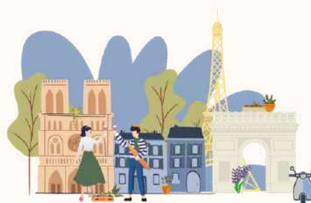
. ILE DE FRANCE