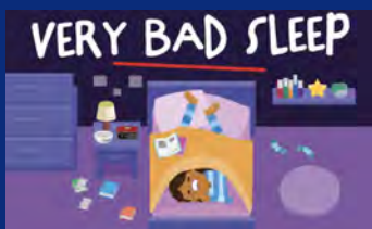
Les devoirs de l'apprenti