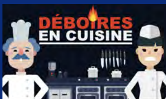
Les droits de l'apprenti