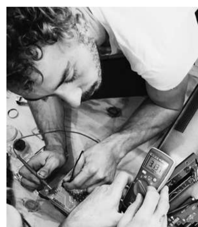
Antoine Thomas Maker

"S'inscrire aux ateliers 'La Pompe', c'est favoriser la rencontre d'autres artistes dans un environnement rural, parfois isolé. Partager des idées, créer ensemble et individuellement. Chacun respectant son propre rythme. Je souhaite ici développer mon activité de costumière, créatrice de masques et accessoires de spectacle."