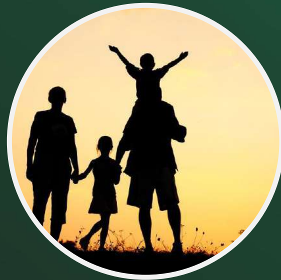
Journées portes ouvertes pour les familles