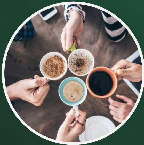
temps dédiés à l'accompagnement dans la parentalité : Café des parents café poussettes...