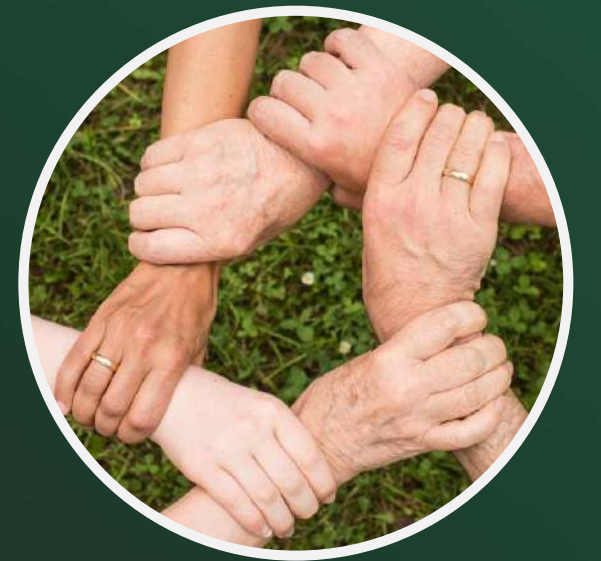
accompagnement et mise en relation des familles avec les associations spécialisées