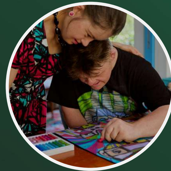
adaptation de la programmation aux publics à besoins spécifiques