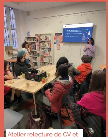
Atelier relecture de CV et lettre de motivation

Le pôle professionnalisation travaille à l'accès à l'emploi pour les étudiant·es en organisant des ateliers de relecture de CV et lettre de motivation, de conseil à la recherche d'emploi et à la rencontre avec des entreprises et des professionnel·les du recrutement . L'objectif est d'aider les étudiant·es sur un temps plus long qu'un panier alimentaire, en favorisant une insertion professionnelle générant de nouvelles sources de revenu.