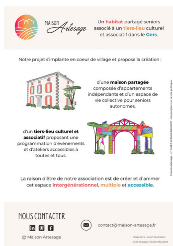
Plaquette de présentation