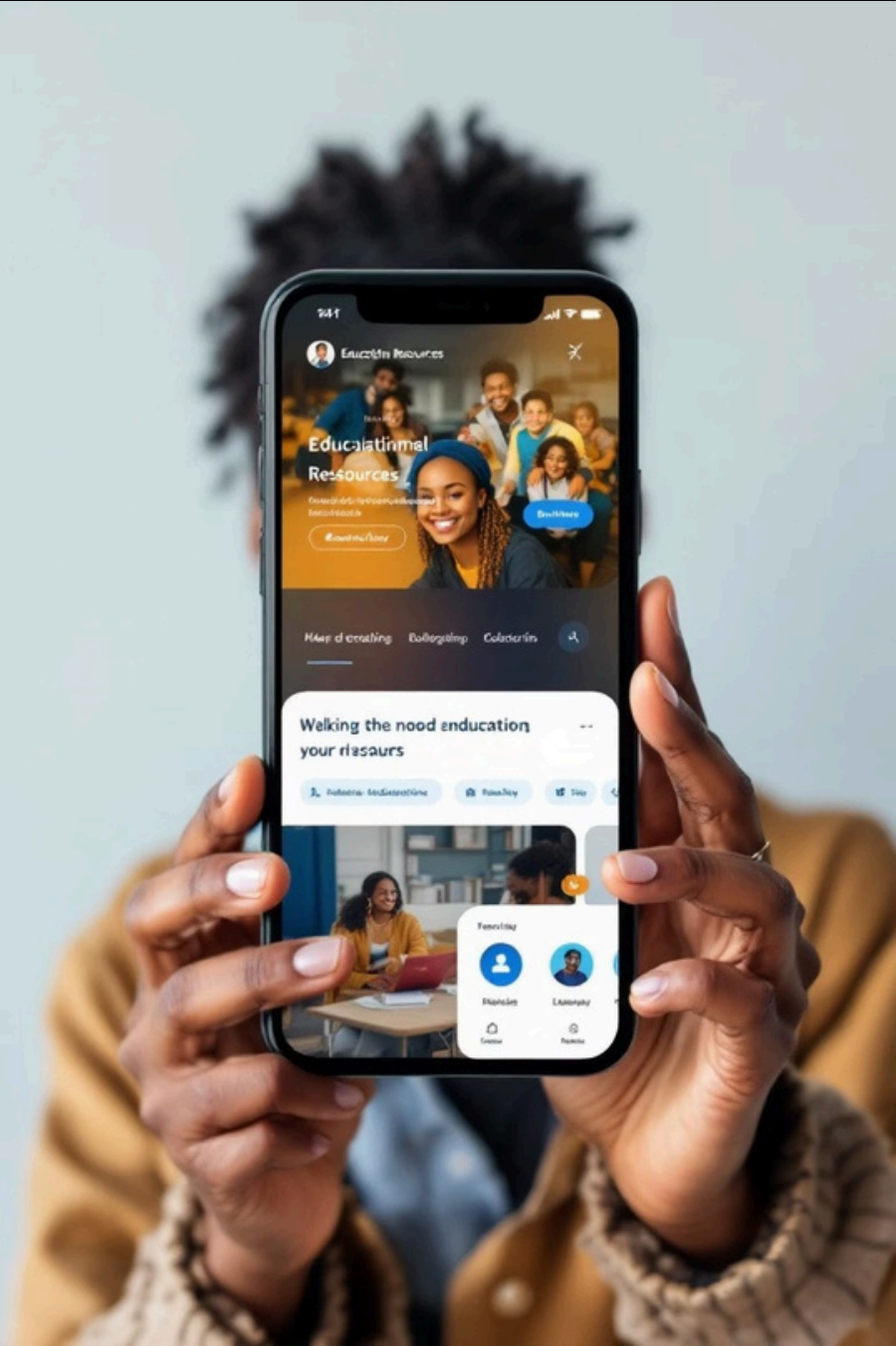
Tableau de bord pour les institutions participant au financement.

Accès aux profils des étudiants pour stages et recrutements.