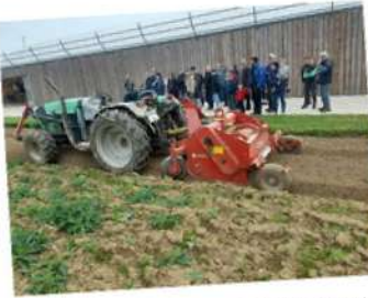
La météo était clémente et douce. Près de 200 personnes en ont profité pour découvrir la ferme de la Chaudouère à Pierre-la-Treiche.