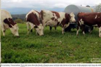
Le jeudi 15 février à Chaligny

Cette initiative est portée par un consortium d'associations agricoles et paysannes : l'Institut de l'Agriculture Biologique et l'Association de l'Agroécologie Grand Est et Bio en Grand Est. L'ARDAC Grand Est et Bio en Grand Est est à l'écoute des producteurs pour tous les aspects de leur projet, il existe en Grand Est deux