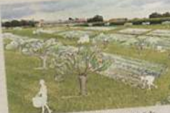
La formation permettra d'identifier les potentiels et les contraintes de son territoire.

S'ancrer dans son territoire, créer son réseau Pour réussir dans le domaine agricole, il est essentiel de savoir identifier les potentiels et les contraintes de son territoire. Il faut également identifier les personnes ressources et créer ses propres réseaux professionnels. Cet axe permettra également de connaître les dynamiques collectives et celles de la région pour avoir les outils