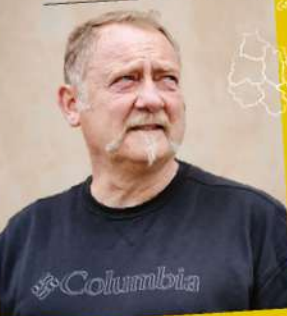
Portrait of a man, likely the author or a key figure in the article.